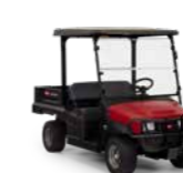
Workman GTX Veicolo polifunzionale

Un veicolo crossover per aree verdi e tappeti erbosi che vanta una combinazione senza paragoni di comfort, funzionalità e controllo. La sua maggiore potenza, gli esclusivi sistemi di sospensioni e freni fanno del Workman GTX il veicolo più versatile e pratico.