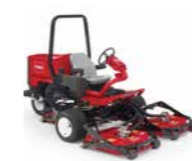
Groundsmaster® 3500-D / 3505-D Tosaerba rotativo

Vuoi giocare nel campionato di prima categoria ad un budget conveniente? Hai già pensato di acquistare attrezzatura Toro di seconda mano/usata? Dai un'occhiata alla pagina 38 per maggiori informazioni.