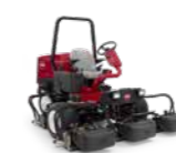
Reelmaster® 3550 Tosaerba elicoidale leggero

Finitura del taglio ★★★★★ Compattazione del terreno ★★★★★★ Raccolta dello sfalcio ★★★★★