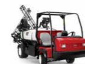
Multi Pro® WM Irroratrice

Questo sistema di irrorazione per i veicoli polifunzionali Toro Workman® serie HD montato su pianale è il più efficiente e avanzato sul mercato, con un'agitazione aggressiva e tempi di risposta più rapidi.