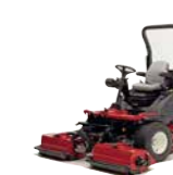
LT-F3000 Tosaerba a tre elementi di taglio con trincia

Finitura del taglio ★★★★★ Compattazione del terreno ★★★★★★ Raccolta dello sfalcio ★★★★★