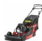
ProStripe® 560 Tosaerba per effetto a strisce

Selezionate l'attrezzatura giusta per la pulizia dopo la gara e uno splendido effetto a strisce.