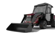
Outcross® Veicolo polifunzionale per i tappeti erbosi

L'Outcross è pura potenza multifunzionale, unica nel suo genere, di facile utilizzo, delicata sul tappeto erboso e utile per il risparmio di tempo, che offre flessibilità, uniformità e produttività per le operazioni di manutenzione dei tappeti erbosi per tutto l'anno.