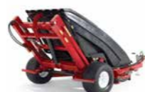
Pro Sweep Spazzatrice di residui

Pro Sweep fornisce un metodo più rapido di raccolta delle carote di arieggiatura e altri detriti organici. La versatile regolazione dell'altezza della spazzola consente in diverse applicazioni.