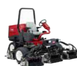
Reelmaster 3555-D / 3575-D Tosaerba elicoidale per grandi superfici

Finitura del taglio ★★★★★ Compattazione del terreno ★★★★★★ Raccolta dello sfalcio ★★★★★