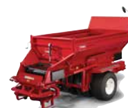
ProPass™ serie 200 / MH-400 Topdresser

Affidati alla gamma di veicoli polifunzionali Toro di ottima qualità per qualsiasi attività, dentro e attorno ai campi sportivi.