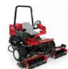
Reelmaster® 3100 Tosaerba elicoidale per piccole aree

Scegli il tosaerba elicoidale Toro Reelmaster ideale per preparare un tappeto erboso impeccabile per il giorno della competizione. Tutti dotati di cilindri EdgeSeries™.