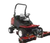
CT2240 Tosaerba elicoidale compatto

Trova l'attrezzatura ideale con cilindri per mantenere i terreni da allenamento al meglio.