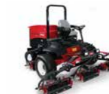
Reelmaster 7000 Tosaerba elicoidale per prestazioni professionali

Finitura del taglio ★★★★★ Compattazione del terreno ★★★★★★ Raccolta dello sfalcio ★★★★★