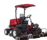
Reelmaster 5010-H Tosaerba elicoidale ibrido per grandi superfici

Finitura del taglio ★★★★★ Compattazione del terreno ★★★★★★ Raccolta dello sfalcio ★★★★★