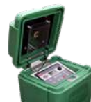
Lynx Smart Hub con LSM Programmatore sul campo

Ottieni accesso all'impianto in loco utilizzando il sofisticato hardware Toro sul campo.