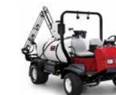
Multi Pro 5800 Irroratrice

Ogni aspetto di questo sistema di irrorazione è stato progettato per fornire una precisione di irrorazione senza paragoni, un'agitazione aggressiva e tempi di risposta più rapidi. Fornisce i volumi di irrorazione desiderati in modo costante, anche negli ambienti più impegnativi.