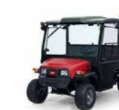
Workman MDX / MDX-D Veicolo polifunzionale

Il duro lavoro non dovrebbe iniziare prima dell'arrivo sul posto di lavoro. Scopri la serie Workman MDX con scocca dallo stile robusto e SRQ™ (Superior Ride Quality) per un comfort ottimale per l'operatore e una maggiore produttività.