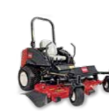
Groundsmaster 7200 / 7210 Tosaerba rotativo con raggio di sterzata pari a zero

Finitura del taglio ★★★★★ Compattazione del terreno ★★★★★★ Raccolta dello sfalcio ★★★★★