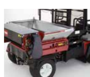
Topdresser 1800 / 2500 Movimentatore di materiali

Se montati su un Toro Workman (1800) o trainati da esso (2500), i topdresser Toro affrontano le attività più intensive e forniscono prestazioni precise e produttive. La trazione integrale garantisce un flusso di applicazione uniforme.