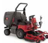
ProLine H800 Tosaerba Direct Collect

Finitura del taglio ★★★★★ Compattazione del terreno ★★★★★★ Raccolta dello sfalcio ★★★★★