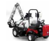
Multi Pro 1750 Irroratrice

La Multi Pro 1750 utilizza un design del sistema di irrorazione avanzato, combinato con i sistemi di controllo all'avanguardia e caratteristiche produttive del veicolo, per creare i volumi di irrorazione più avanzati, efficienti e precisi.